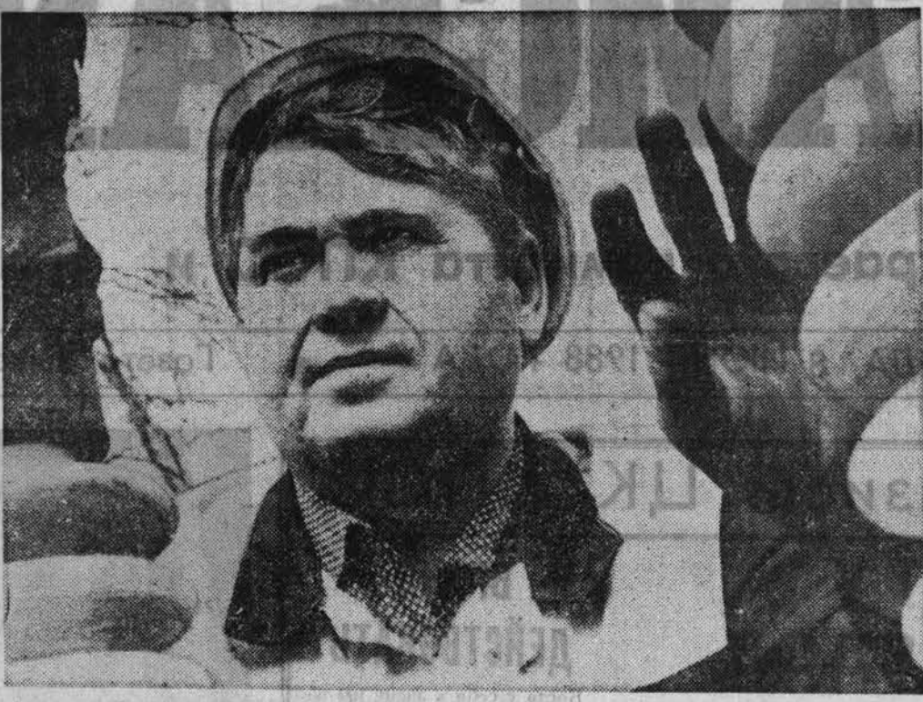
ЦЕНТРАЛЬНЫМ СОВЕТОМ Общества охраны природы по согласованию с Госагропромом и Министерством меллиорации и водного хозяйства РСФСР в 1988 году объявлен Всероссийский рейд по проверке использования меллиорированных земель на территории РСФСР. Краевой совет общества

А дело вот в чем. Подрядные бригады, чтобы не терять заработки, потребовали от администрации наладить систему охлаждения молока на месте. Ведь