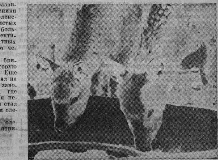
Чарышский район.