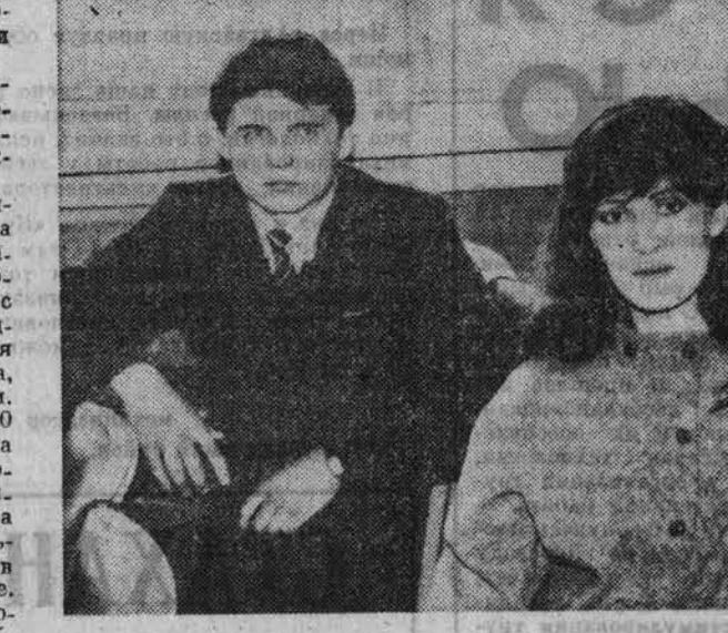
Группе учащихся училищ и техникумов и студентов вузов края вручены свидетельства «Стипендиат профсоюзов СССР».

ГРУППЕ УЧАЩИХСЯ УЧИЛИЩ И ТЕХНИКУМОВ И СТУДЕНТОВ ВУЗОВ КРАЯ ВРУЧЕНЫ СВИДЕТЕЛЬСТВА «СТИПЕНДИАТ ПРОФСОЮЗОВ СССР». На эту встречу в крайсовпроф с руководителями профсоюзов и работниками крайкома ВЛКСМ пришла молодежь — учащиеся различных училищ, техникумов и студентов вузов края. И приглашали их по торжественному поводу — каждому было вручено свидетельство «Стипендиат профсоюзов СССР».