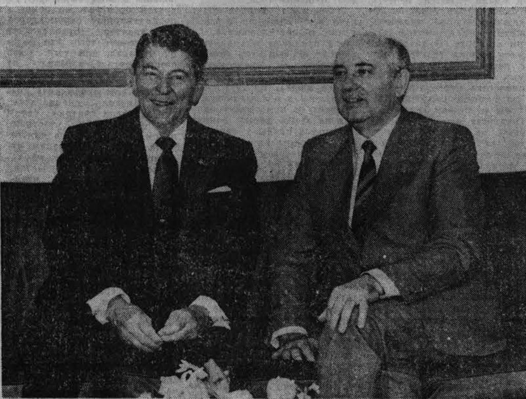
На снимке: во время беседы.

Гости приветствовали первый секретарь правления Союза писателей СССР В. Карпов.