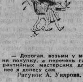
Рисовал А. Уварова.

— Дорогая, возьми в магазин покупки, а вечером в галантинных мастерских для нее я доведу сам.