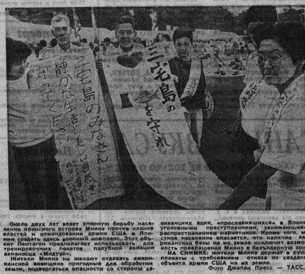
Около двух лет ведет упорную борьбу наследие японского острова Мияки против планов властей и командования армии США...