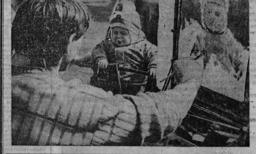
Волонтеры учащиеся Новоалтайского художественного училища в прошедшее воскресенье на выставке В. И. Ленина кова...