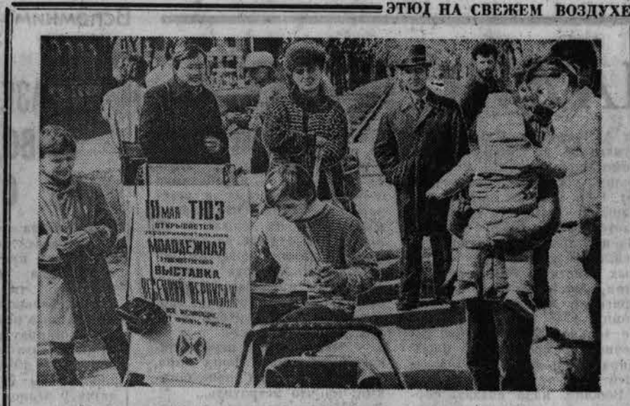
ЭТОГО НА СВЕЖЕМ ВОЗДУХЕ... Появление учащихся Новоалтайского художественного училища в прошедшее воскресенье на выставке В. И. Ленина кова...