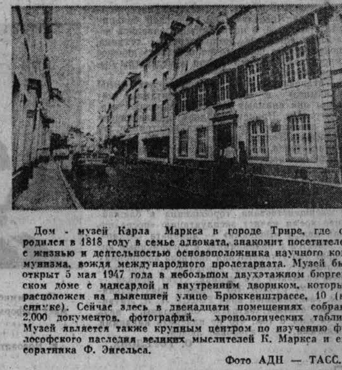
Дом - музей Карла Маркса в городе Трире, где он родился в 1818 году в семье адвоката, знакомит посетителя с жизнью и деятельностью основоположника научного коммунизма...