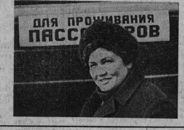
Для проживания пассажиров

еще пару вагонов держать. Однако надо заметить, что если уж вылезли за дело, то следует доводить его до конца и хотя бы минимально удобить тем, кто приходится жить в этих вагонах, порой несколько суток. В. ВЫБОРОВ.