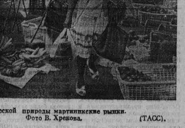
НА СНИМКЕ: богаты дарам тропической природы мартиникские рынки.

По мнению председателя организации Роберта Мартинира, в системе местных налогов заложена явная несправедливость. Так, у наименее обеспеченной американской семьи из четырех человек с годовым доходом 8,580 долларов местные налоги на продукты питания, потребительские товары, бензин отнимают примерно 5,4 проц. бюджета. Семья, получающая в год примерно 45 тыс. долларов, отдает на эти налоги только 2,9 проц. своего бюджета, а семья, считающаяся богатой, с годовым доходом 612 тыс. долларов и больше, — всего лишь 1,1 проц. В целом данные, полученные в ходе исследования, свидетельствуют, что чем выше доходы американцев, тем меньше они платят местных налогов.