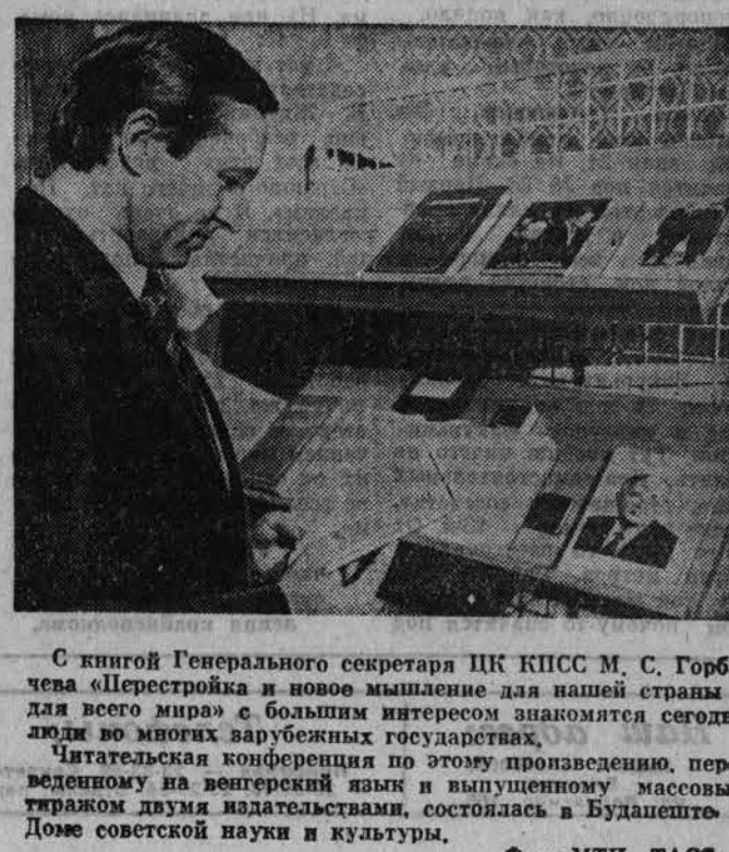
С книгой Генерального секретаря ЦК КПСС М. С. Горбачева «Перестройка и новое мышление для нашей страны и для всего мира»...