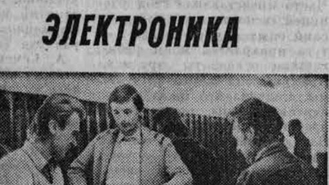
В Барнаульском прижелезнодорожном почтамте запущена в эксплуатацию автоматическая писемосортировочная машина...