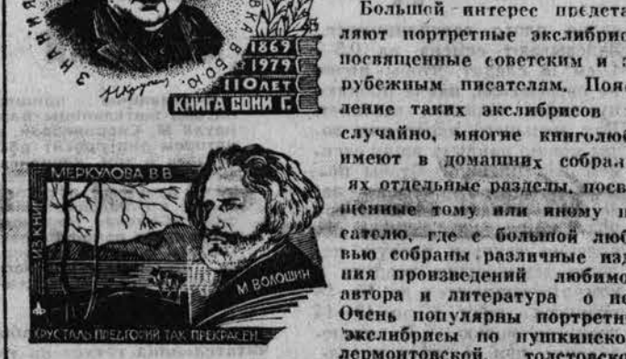
НА РЕПРОДУКЦИЯХ: эскизы портретов Надежды Константиновны Крупской (художник из Симферополя В. Липецкий) и поэта М. Волошина (кемеровский художник В. Зверев).