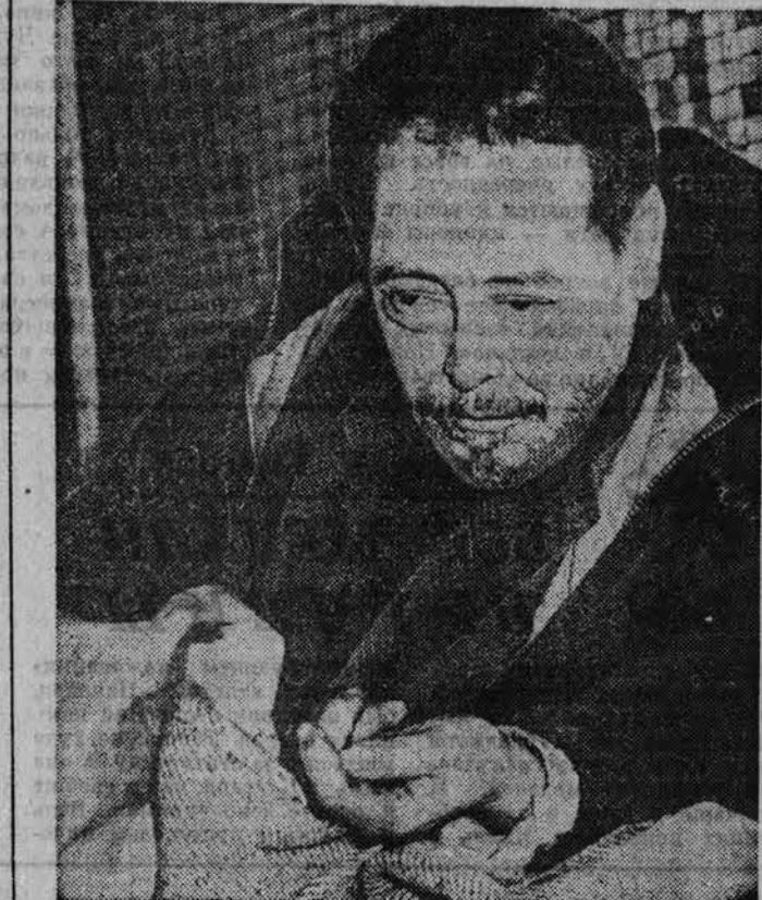
НА СНИМКЕ: иммигрант из Португалии, так и не нашедший возможности заработать в Испании на кусок хлеба.