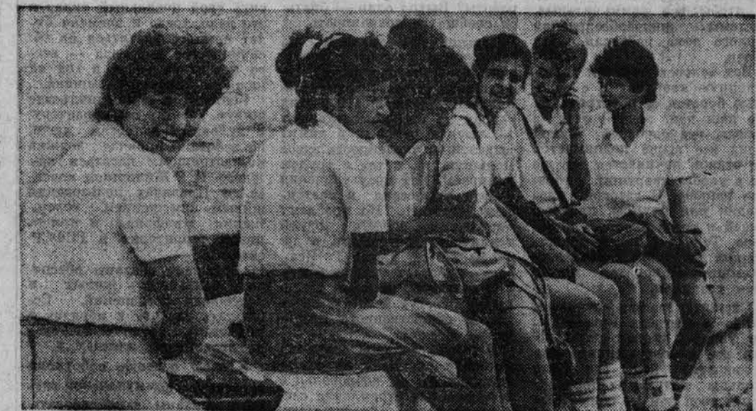
За годы народной власти Куба добилась впечатляющих успехов в экономическом и социальном строительстве. На страны неправых Куба превратилась в государство всеобщего среднего образования. НА СНИМКЕ: молодость республики.