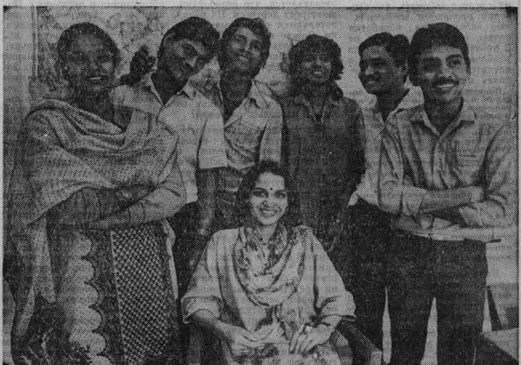
Эти юности и девушки — студенты Центра русских исследований при Делийском университете имени Джавахарлала Неру...