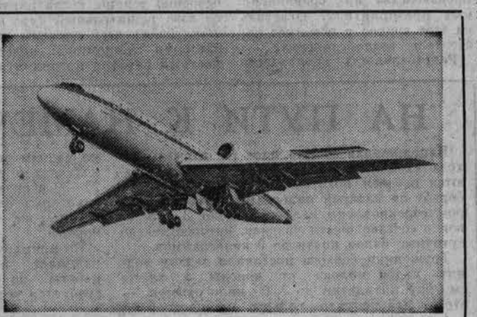
В полете Як-42. Фотохроника ТАСС.

боту пилотов из кабины вертолета. Это было настоящее мастерство, они понимали друг друга даже в полуслова, а с полувзглядом. Машина чутко отзывалась на малейшее движение человека. Выпученный был много и о работе экипажа, и о самом полете. Но рассказать