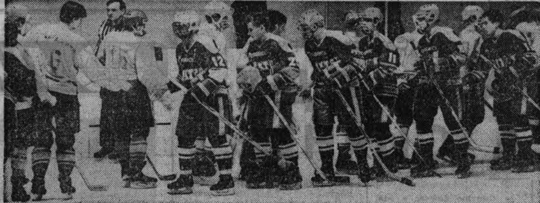
Хоккей с шайбой

Мама моя чуткая, ласковая, умеет выслушать, поддержать, и я да себе слово — никогда не обижать своих близких.