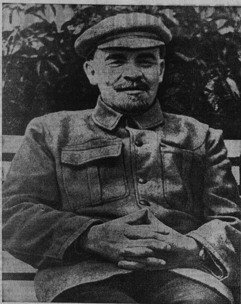
В. И. Ленин в Горках.

Было... Прячусь тени в окладах старых гардин. Тихо. Холодно. Ленин