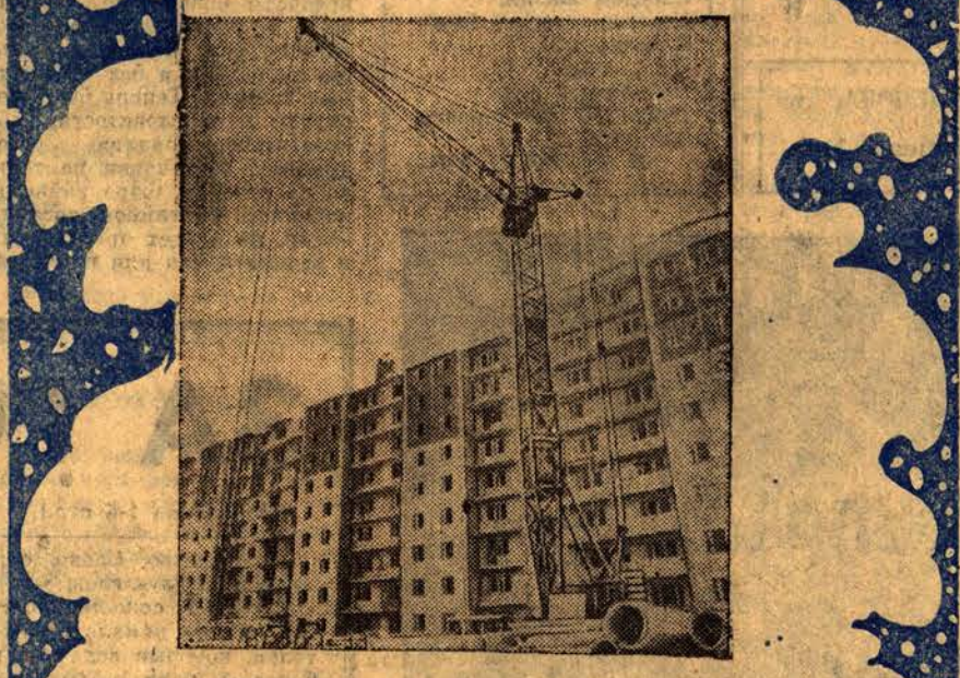
ПРОГРАММЕ ЖИЛИЩНОГО СТРОИТЕЛЬСТВА — ПОСТОЯННОЕ ВНИМАНИЕ

Обыкновенный славлю календарь — собранье наших дней быстротекущих, за четко отшлифованную грань меж прожитым мгновением и грядущим. За каждый многотрудный славлю день! За то, что тыма пасует перед светом, за эту разукрашенную сль, за эти новогодние приветы. Как струны, разгулдись провода. Они не закуржавели в тумане. Наверно, это наши телеграммы под Новый год их греют в холода. Виталий ШЕВЧЕНКО.