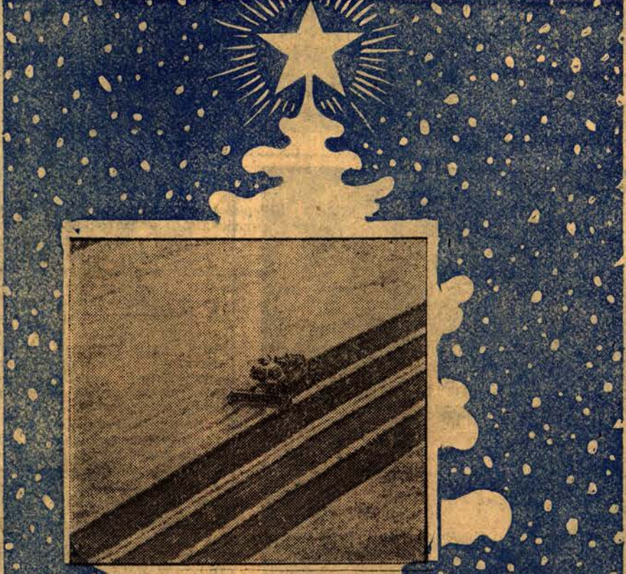
СИЛА АЛТАЯ, СЛАВА АЛТАЯ, ГОРДОСТЬ АЛТАЯ — ХЛЕБ!