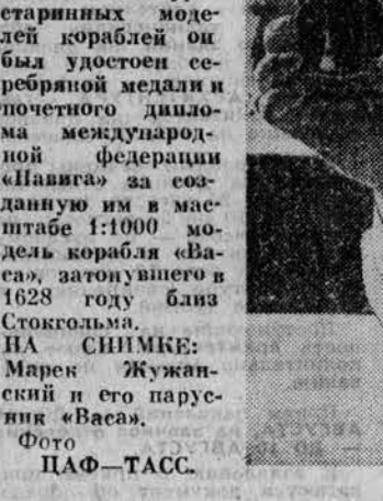
НА СНИМКАХ: Марек Жужанский и его парусник «Васа».

Марек Жужанский из Гданьска все свое свободное время посвящает моделированию судов. На сегодняшний день в Гуане (Франция) Международной выставке — конкурсе старинных моделей кораблей он был удостоен серебряной медали и почетного диплома международной федерации «Навигат» за самую маленькую и в масштабе 1:1000 модель корабля «Васа», затонувшего в 1628 году близ Стокгольма.