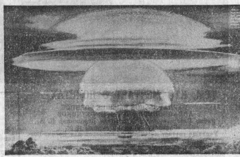
В ПЕНТАГОНЕ ПРИНЕС ЗДОРОВЬЕ И ЖИЗНЬ МЕСТНЫХ ЖИТЕЛЕЙ, КОТОРЫЕ БЫЛИ «ВРЕМЕННО» ВЫВОЗНЫ НА ДРУГИЕ ОСТРОВА МИКРОНЕЗИИ. НО И ЗДЕСЬ ОНИ ПОВЕРГАЛИСЬ СИЛЬНОМУ ОБЛУЧЕНИЮ. ОДНАКО США НЕ ТОЛЬКО НЕ ПРЕКРАТИЛИ ИСПЫТАНИЯ, НО ДАЖЕ НЕ УДОСУЩИЛИСЬ ОКАЗАТЬ ПОМОЩЬ ПОСТРАДАВШИМ.

ТОКИО, 26 декабря. В Осие завершился советско-японский научный симпозиум, на котором обсуждались вопросы дальнейшего развития научных обменов между учеными Советского Союза и Японии. Участники симпозиума уже третьего по счету подчеркнули, что инициативы Советского Союза по развитию международного сотрудничества в Азиатско-Тихоокеанском регионе, перестройка внешнеэкономических связей открывают новые благоприятные перспективы совместных действий ученых по разработке научно-практических задач межконтинентальной кооперации. В симпозиуме участвовали представители Дальневосточного научного центра Академии наук СССР и ведущие ученые японских исследовательских центров Осакы, Токио и Хонгайдо.