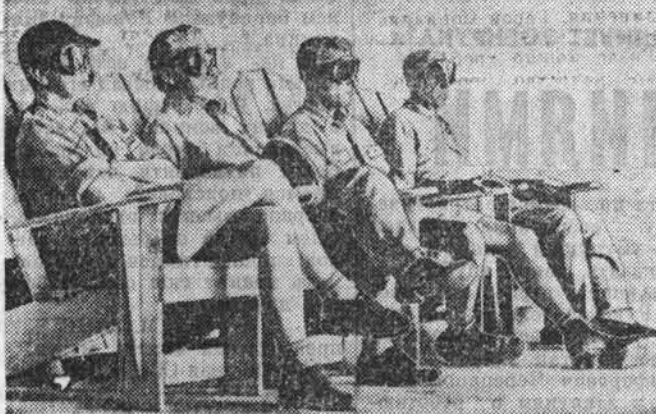
Трагедия народа Викини, обреченного на медленное вымирание, продолжается и по сей день. США продолжают использовать территорию Маршалловых островов для испытаний межконтинентальных баллистических ракет, им уготована важная роль в реализации программы «звездных войн».

ВИКИНИ. Название этого небольшого тихоокеанского атолла, входящего в состав Маршалловых островов, известно наряду с многострадальными Хиросимой и Нагасаки. На протяжении 12 лет, начиная с 1946 года, американская военная авиация здесь испытывала атомные и водородные устройства. Чистые воды лагуны и территория атолла надолго оказались зараженными радиоактивными осадками. В жертву своим милитаристским амбициям Пентагон принес здоровье и жизнь местных жителей, которые были «временное» вывозили на другие острова Микронезии. Но и здесь они подвергались сильному облучению. Однако США не только не прекратили испытания, но даже не удосужились оказать помощь пострадавшим.