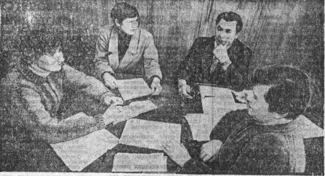
РЕПОРТАЖ ИЗ ПЕРВИЧНОЙ ОРГАНИЗАЦИИ

А творческая атмосфера невозможна без взаимной доброжелательности и требовательности. Кажется бы, что тут зависть от журналистской «первички»? Многие. Если «первичка» не «бумажная», а боевая, действующая. В «Ленинском знаменн» мы, например, узнали, что по инициативе членов СЖК редакция «рассталась» с двумя газетчиками, моральный облик которых не соответство-