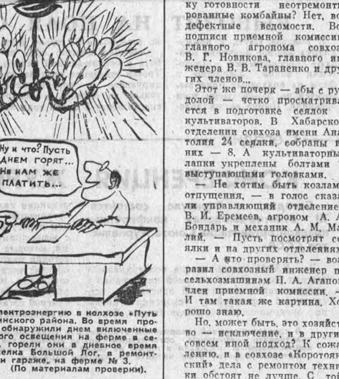
Не экономят электроэнергию в колхозе «Путь Ленина» Крутихинского района. Во время проверки дозорные обнаружили дни выключенные лампы... наружного освещения на ферме в совхозе «Коротоянский» дела с ремонтом техники обстоят не лучше. С той правдой, разницей, что за ка-