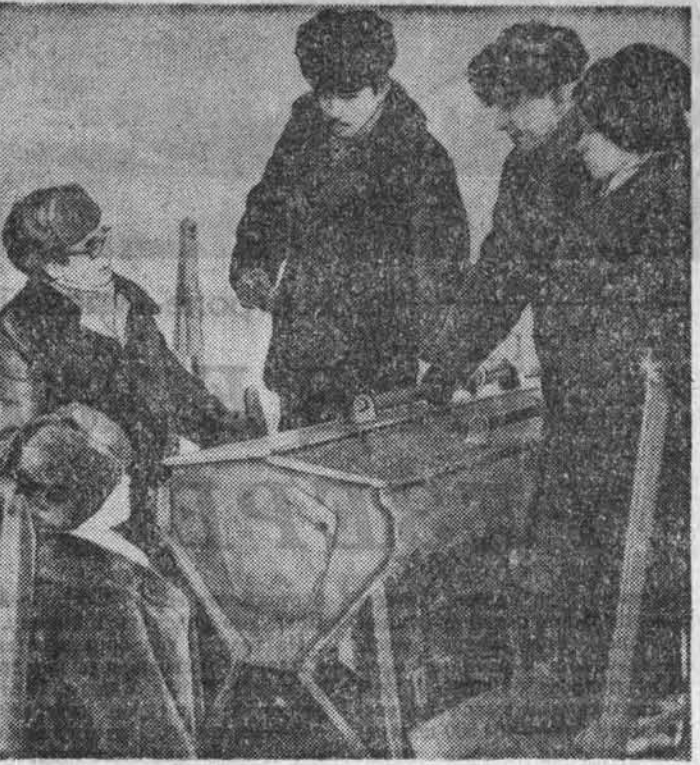
Немало забот сейчас у сельских дозорных. Но и ряд первоочередных — контроль за ремонтом техники. Активно содействует этому группа народного контроля колхоза «Красное знамя» Троицкого района. Дозорные регулярно проводят рейды и проверки хранения техники.