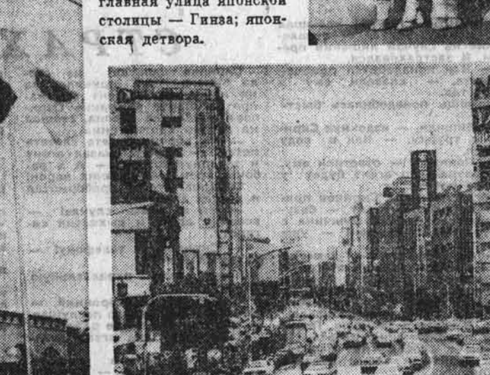
люди и судьбы