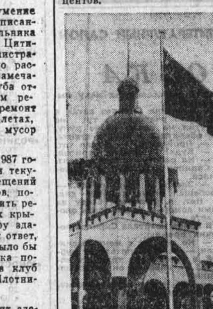
люди и судьбы

Зимой, конечно, о кровле нет смысла задумываться — над головой не каплет. Что касается работ внутри помещения, то редакция нетрудно было убедиться в вашем оптимизме такого завершения. Да, редакция так и не получила для этих работ были выделены