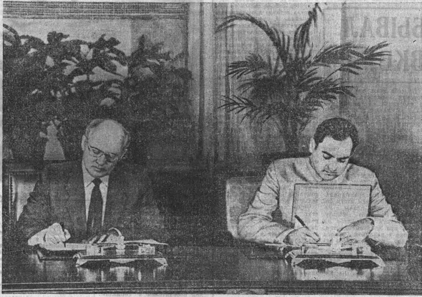
Подписание советско-индийских документов.