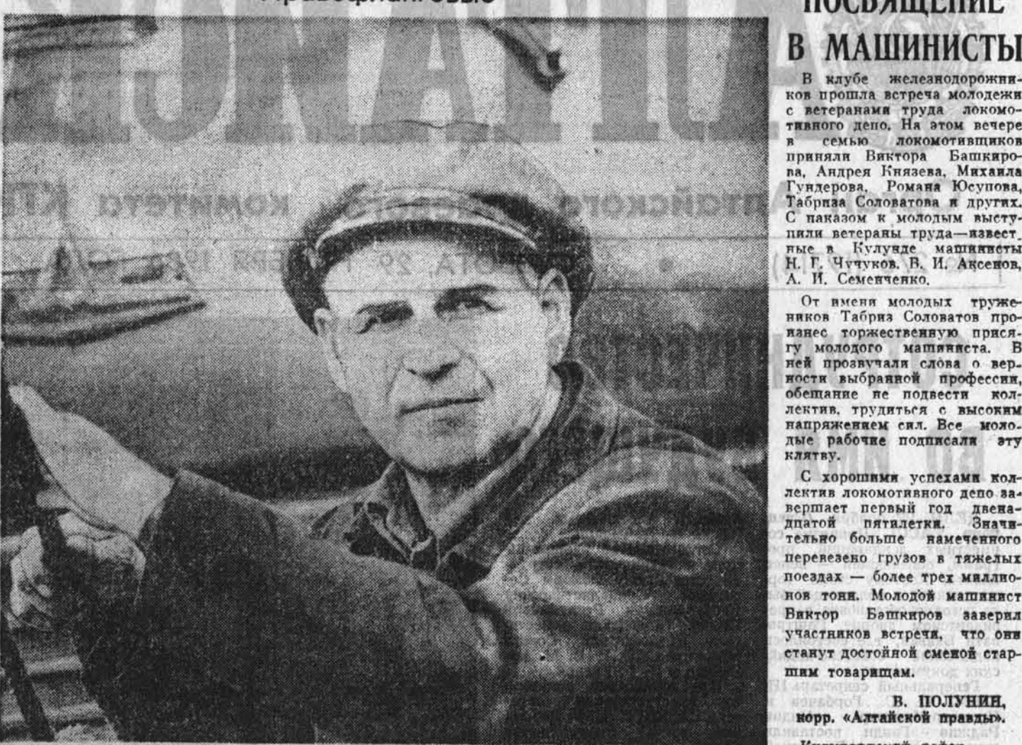
В коллективе УМСП-11 Бийского демонстрального...