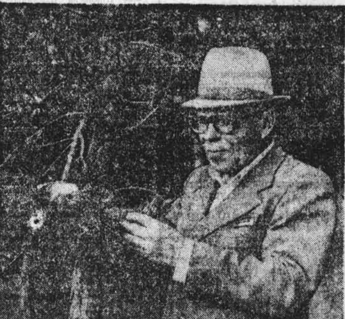
А. АЛЕКСЕЕВ. Курьянский район.

Василий Кириллович, дав мне посмотреть, сказал легкомысленно: «Убедитесь, какое точное название дали люди этой скале? А нам ведь не только любоваться, сбегать назло эту красоту...»