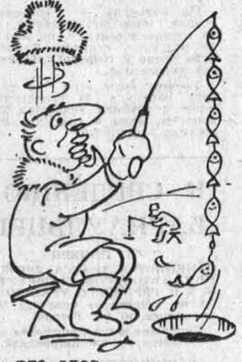
БЕЗ СЛОВ. Рис. Г. Вильямс.