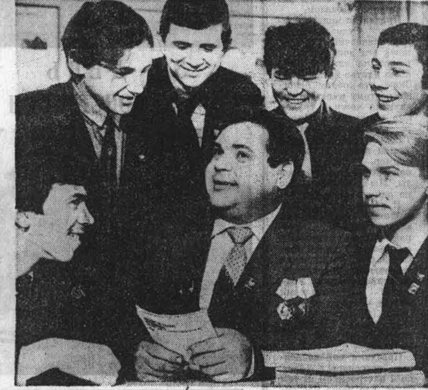
О времени и о себе