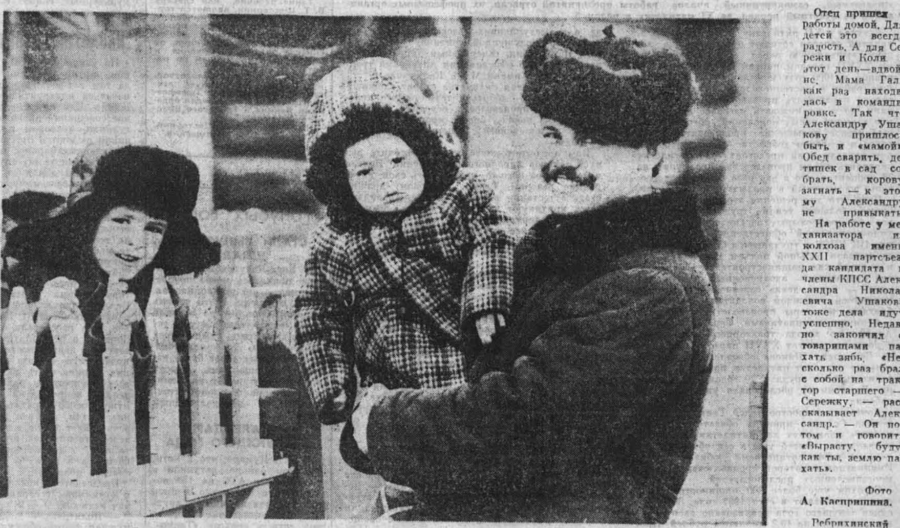
Проверяем выполнение обязательств