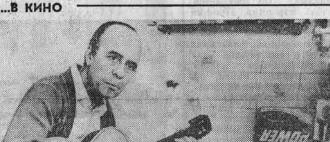
«ОПЕРЕТТА — ЛЮБОВЬ МОЯ»

«ПО ГЛАВНОЙ УЛИЦЕ С ОРКЕСТРОМ». Наш фильм — о верности мечте, идеалам, самому себе.