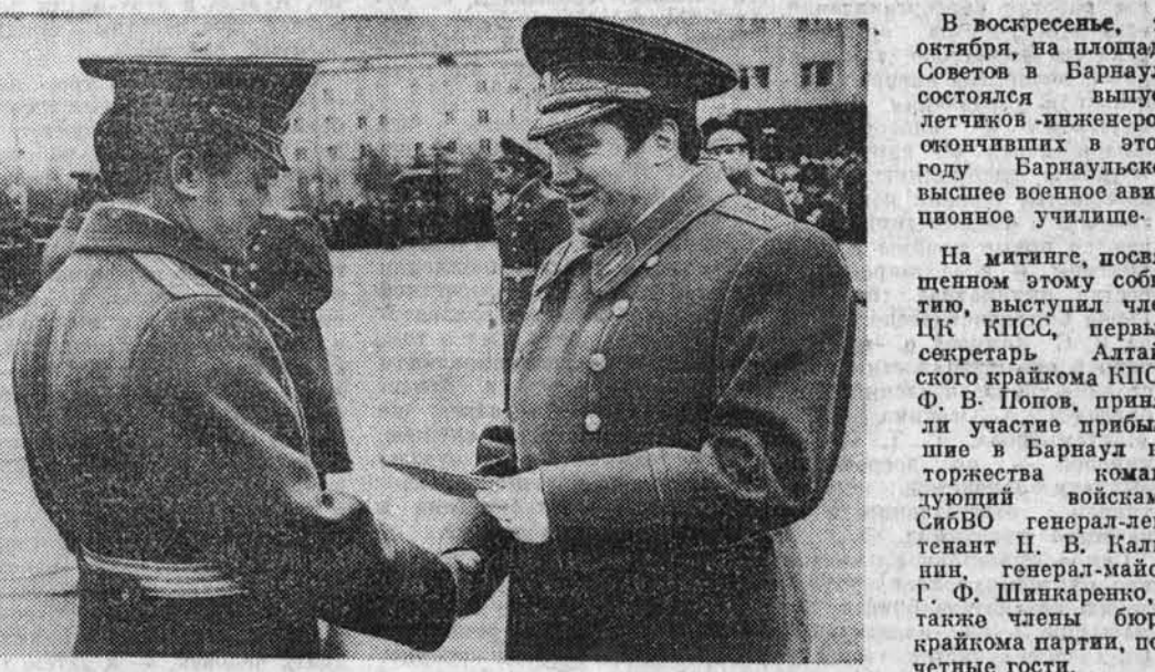
На снимках: торжественный марш выпускников; дипломы молодым лейтенантам вручает командующий войсками СибВО генерал-лейтенант Н. В. Калинин.

Репортаж с торжества, посвященных шестнадцатому выпуску в БВВАУЛ, читайте на четвертой странице.