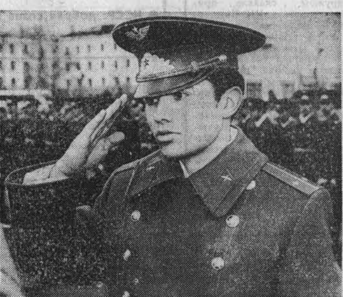
А. ГЕРАСИМОВ, корр. «Алтайской правды».