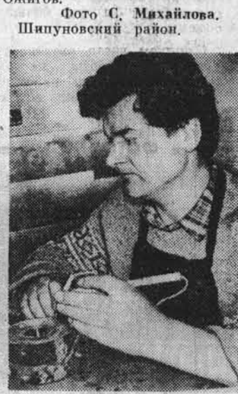
Шинуюнский район.