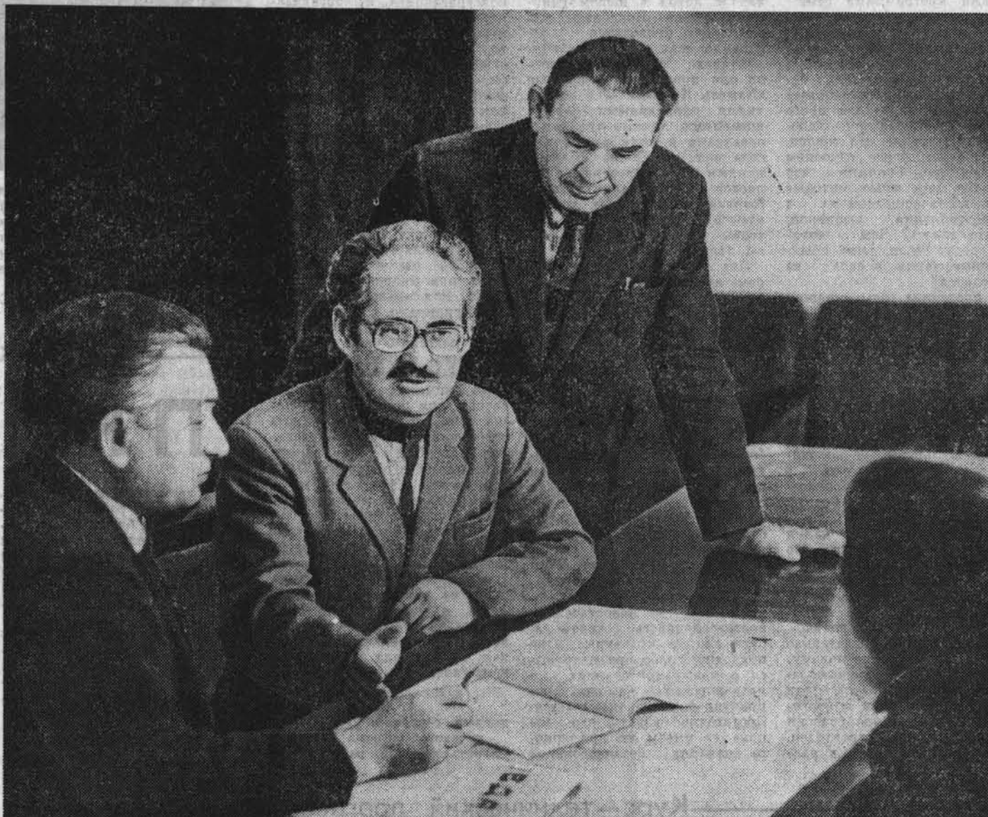
Бюро краевого комитета КПСС на заседании, состоявшемся 25 сентября, рассмотрело вопрос о плане первоочередных мероприятий по реализации постановлений ЦК КПСС и Совета Министров СССР по вопросам совершенствования управления строительством, комплексом страны и хозяйственного механизма в строительстве и утвердило план основных организационно-политических мероприятий по данному вопросу.

Пропандист всегда среди людей, он на переднем крае идеологической работы. Его партийное слово должно уверенно звучать в каждом коллективе, побуждать к активной борьбе за выполнение решений XXVII съезда партии, задания первого года двенадцатилетия. Сделать все возможное для полной активизации человеческого фактора, для реализации творческого потенциала трудящихся — вот что сегодня ждет партия от каждого пропагандиста.