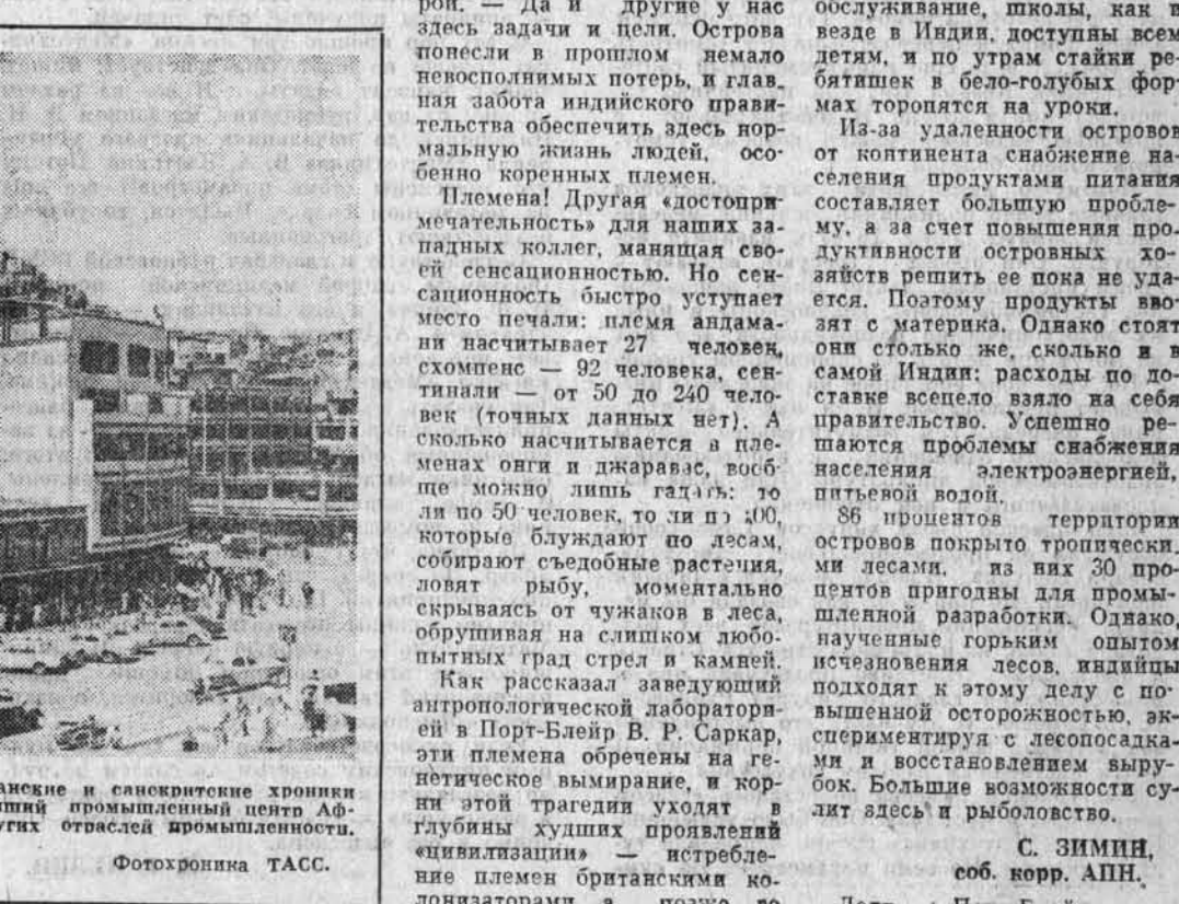
Афганская столица — один из древнейших городов мира. Афганские и санскритские хроники относят его основание к началу нашей эры. Ныне это крупнейший промышленный центр Афганистана. Здесь сосредоточены предприятия легкой, пищевой, других отраслей промышленности.