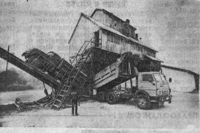
Выполнили первую заповедь