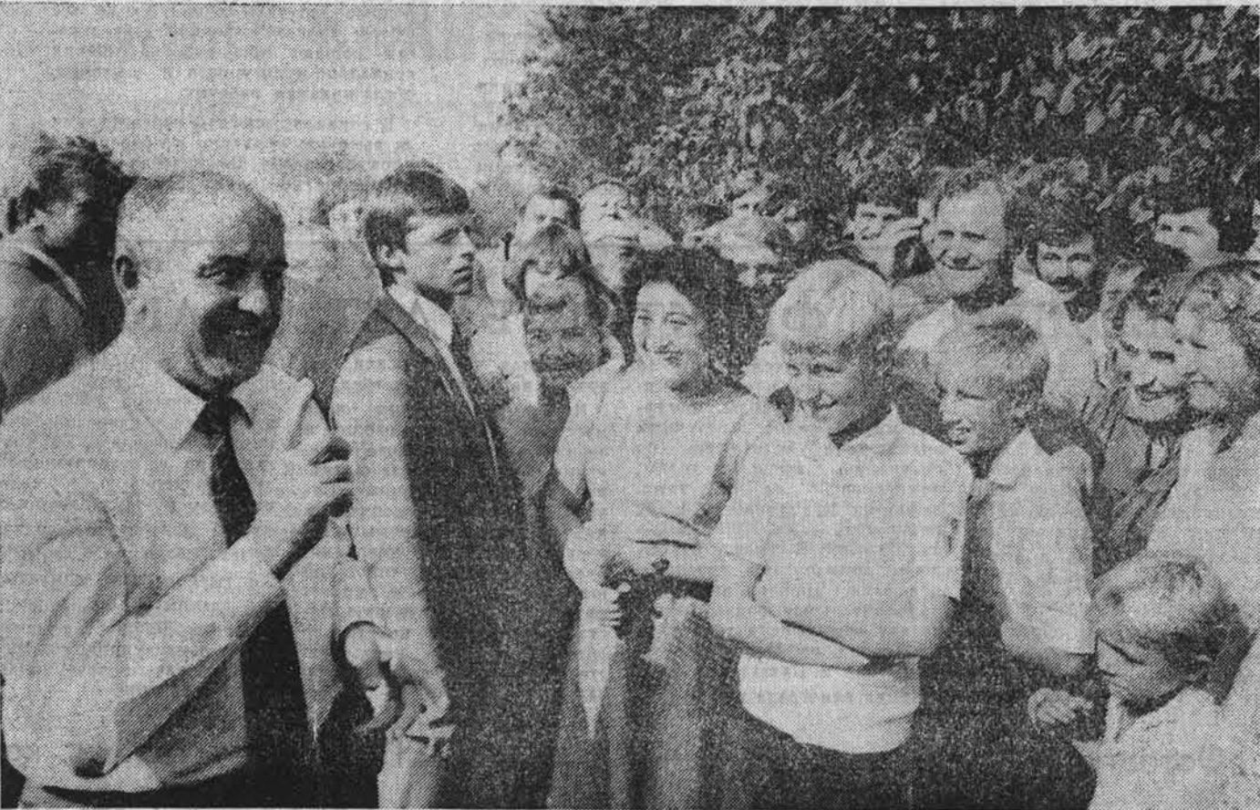
Встреча М. С. Горбачева с жителями станицы Новотитаровская Тимашевского района.

Касаясь борьбы с нетрудовыми доходами, М. С. Горбачев сказал: Мы осуждаем, когда некоторые лица действуют в ущерб интересам общества. Других, не участвующих в общественных делах, не вносящих свой вклад в работу предприятий, колхозов, совхозов, хотя развернуть свои частнохозяйственные устремления. Вместе с тем надо поддерживать всех, кто вырабатывает продукты за счет своей трудовой деятельности, тех, кто сочетает работу в общественном производстве и на своем участке. Надо, чтобы все, что он вырабатывает, реализовывалось на основе договоров с кооперацией. Вот тогда это не-