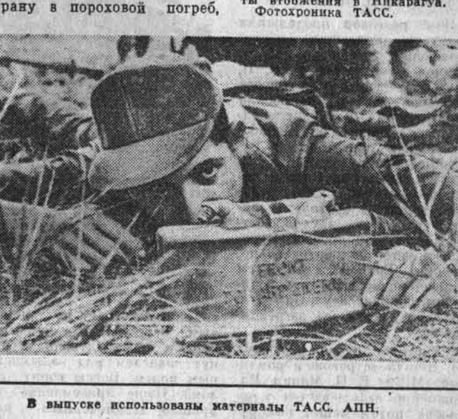
В выпуске использованы материалы ТАСС, АПН.

«НА СНИМКЕ: солдат ливанской армии обучается полновому делу в ходе операции американско-гондурасских маневров. Обращаются методы боевых действий, известные воюющим в Никарагуа».