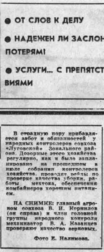
В СТРАНИЦЕ ПОРУ ПРИБЛИЖАЮТСЯ

от слов к делу, надежен ли заслон потерям, услуги... с препятствиями