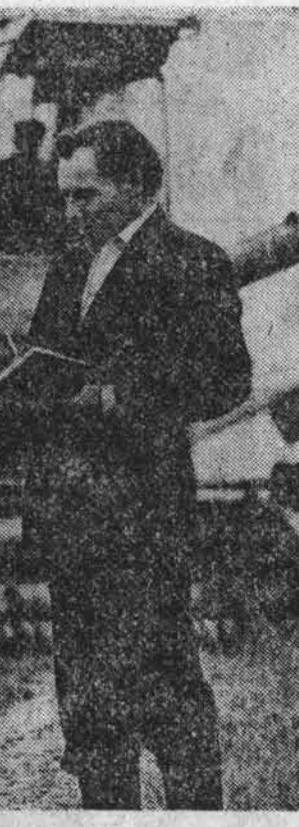
В СТРАНИЦЕ ПОРУ ПРИБЛИЖАЮТСЯ