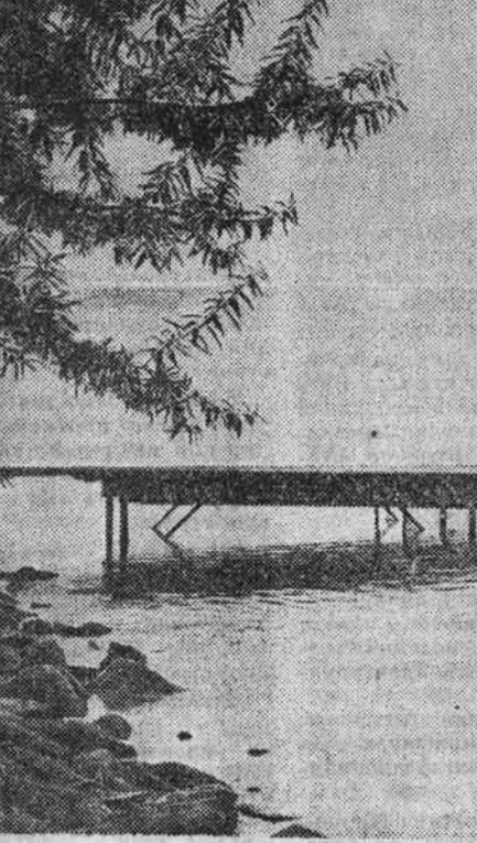
«ПОСЛЕДНИЕ ДНИ ЛЕТА»