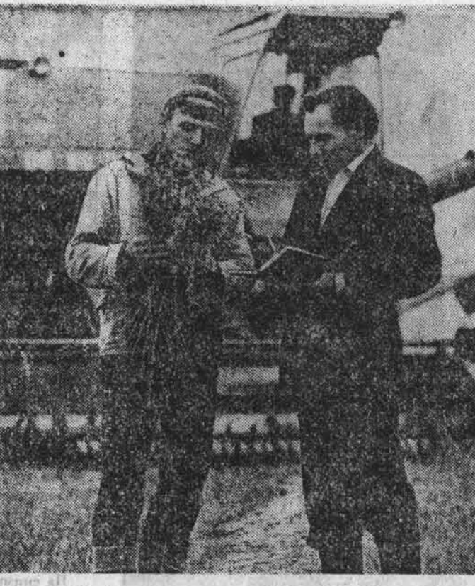
ВЕСТИ С МЕСТ