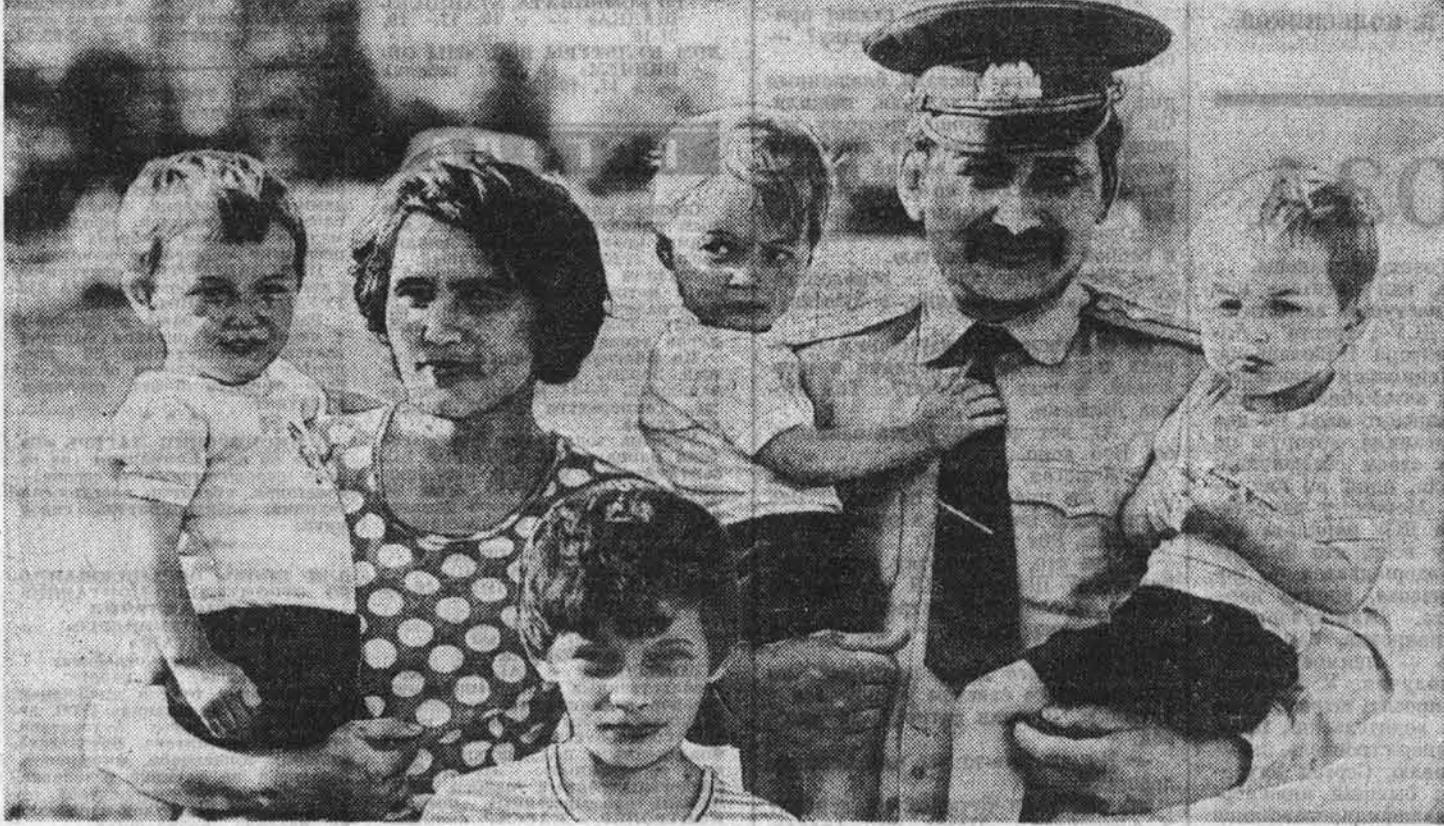
СКОРО — НОВЫЙ УЧЕБНЫЙ ГОД