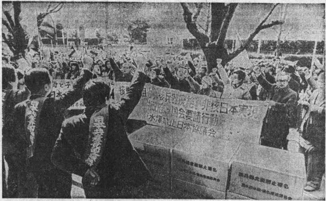
В Японии прошли традиционные марши мира, которые являются крупнейшим событием в антиядерном движении страны. Одновременно с маршами проводился сбор подписей под «Воззванием Хиросимы и Нагасаки» — документом военных организаций с призывом к аннулированию любого оружия. В настоящее время под ним поставлено подписей более 12 миллионов человек.