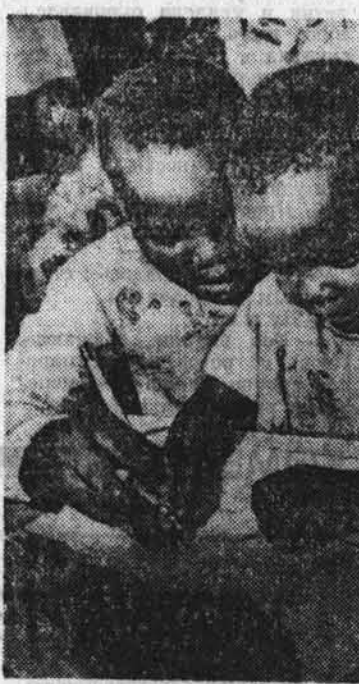
НА СНИМКЕ: воспитанники детского сада.

● МОЗАМБИК. Более 60 тысяч и детских садов для детей трудящихся открыто за годы независимости в мозамбинской столице и ее пригородах. Это создает широчайшие возможности для активного вовлечения в производственную и общественную деятельность мозамбинских женщин.