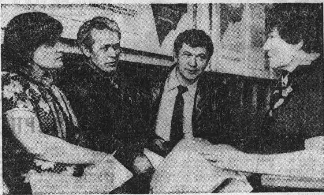
Вести с мест

Содержательно, интересно прошло собрание коллектива чугунолитейного цеха Алтайского завода агрегатов, где состоялся отчет группы народного контроля.