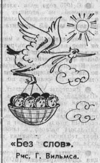
«Без слов». Рис. Г. Вильмса.