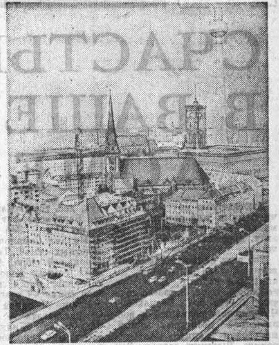
▲ НА СНИМКЕ: сегодня в Берлине, столице немецкого рабоче-крестьянского государства.

Венгрия в свою очередь участвует в строительстве важных хозяйственных объектов на территории Советского Союза. В предстоящие годы совместные работы будут вестись на 25 предприятиях различных отраслей промышленности. Дальнейшее развитие получит сотрудничество в таких областях, как химическая и нефтеперерабатывающая промышленность, микроэлектроника, робототехника, производство средств связи, сельское хозяйство. Активное участие в осуществлении этих программ примут флагманы венгерской индустрии — Дунайский нефтеперерабатывающий комбинат, сепиферварский завод «Видеотон», многие другие.