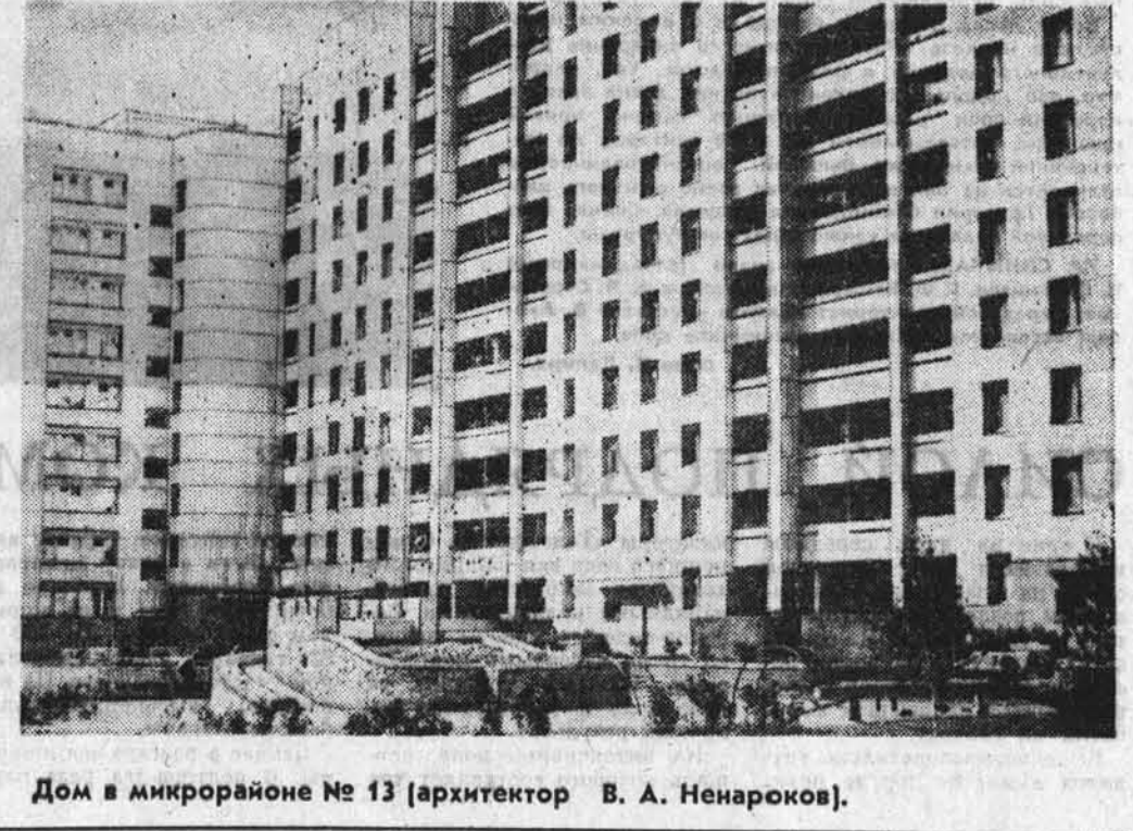
Дом в микрорайоне № 13 (архитектор В. А. Ненароков).