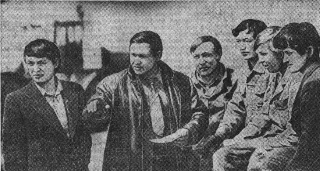
Фото-репортаж ИДЕТ СЕВ ПШЕНИЦЫ

Массовый сев зерновых в разгаре. Долг хлеборобов края — провести его с предельно высокими сроками и с высоким качеством и тем самым заложить добрую основу для выращивания хорошего урожая, выполнения планов и обязательств по поставкам Родине зерна, другой растениеводческой продукции в первом году двенадцатой пятилетки.