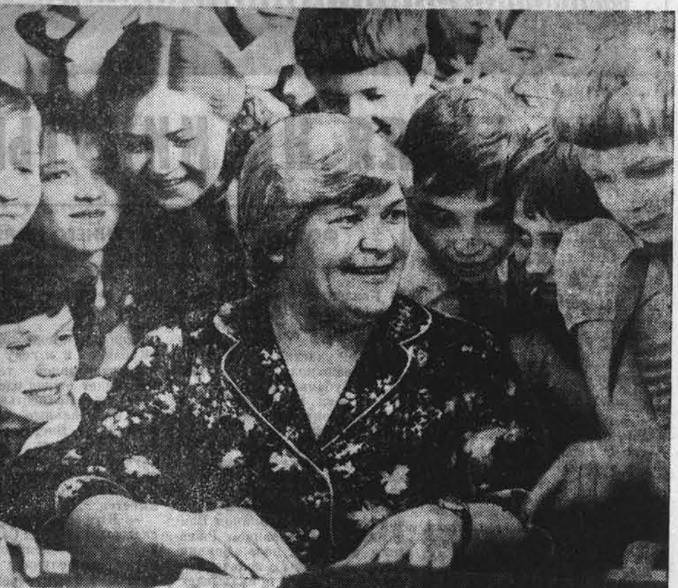
Совершенно немного времени осталось до конца учебного года. Проэвент в школах прощальный звонок, быстро промелькнут экзамены, отшумят балы...