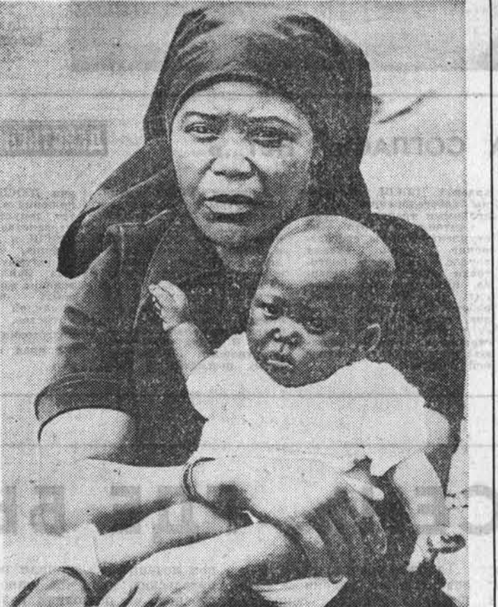
Трудящиеся Народной Республики Ангола отмечают в нынешнем году 25-летие создания Организации ангольских женщин (ОМА). Около миллиона членов насчитывается в ее рядах. Они активно выступают за мир и социальный прогресс, а также за всеобщее вооружение, за предотвращение ядерной войны. НА СНИМКЕ: протестантка из пригорода Луанды, столица страны.