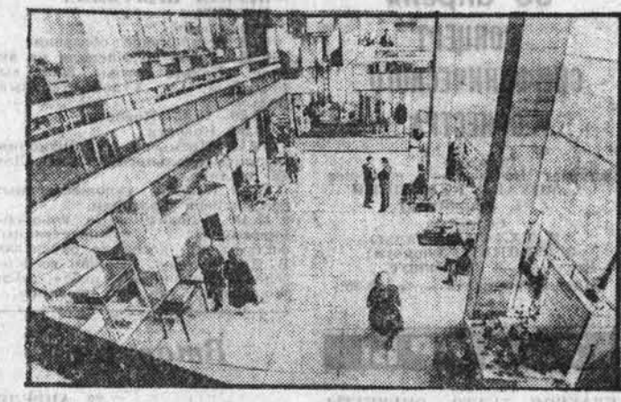
Производство новых товаров, разнообразить их ассортимент, повышать качество.

других изделий, на что справедливо жалуются торговцы. Не балуют покупателя новинками объединение Алтайхимвиром, Славгородский завод радиопаратуры, завод «Алтайсельманш», Барнаульский аппаратно-механический завод, управление топливной промышленности. Некоторые из них из года в год показывают лишь опытные образцы товаров на выставках, но под всякими предлогами откладывают их освоение и производство. Особенно в большом долгу перед покупателем барнаульское швейное объединение «Авангард». Висюлек швейное объединение, Горно-Алтайская обувная фабрика и многие другие предприятия легкой промышленности, где недопоставки товаров исчисляются десятками тысяч рублей. В реализации Комплексной программы развития производства товаров народного потребления и сферы услуг на 1986—2000 годы призваны все трудящиеся коллективы края. И тем острее, что число предприятий и организаций, включившихся в сферу производства изделий массового спроса, неуклонно растет. За последнюю пятилетку оно увеличилось более чем в полтора раза. Многие из них стремятся постоянно расши-