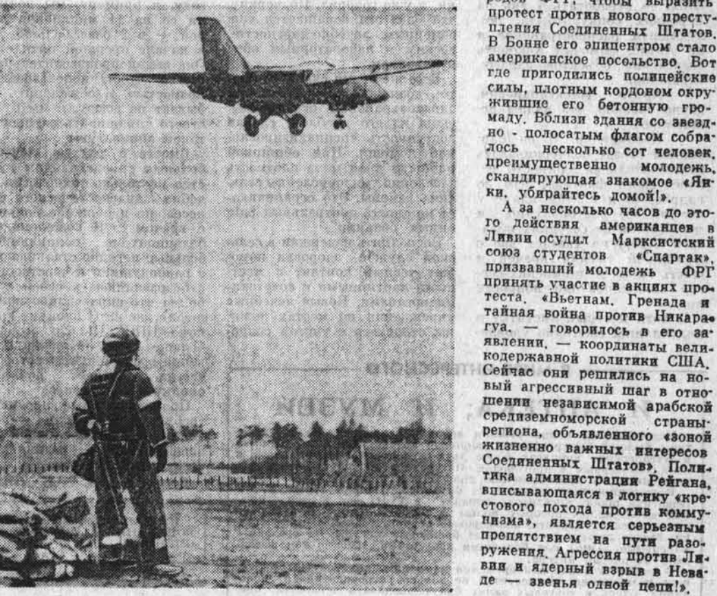
НА СНИМКЕ: американский бомбардировщик F-111 взлетает с базы ВВС США в Алтэр-Хейфрод (Великобритания) и берет курс на Ливию.