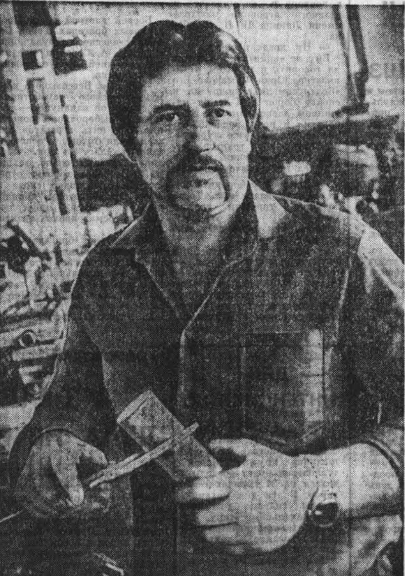
План первого полугодия — досрочно

(Из Политического доклада ЦК КПСС XXVII съезду партии)