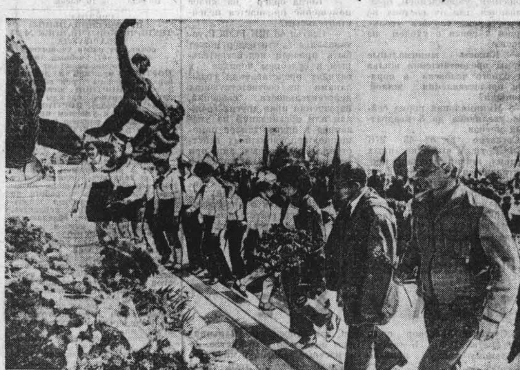
Созидательным трудом на благо родины, социализма и мира, претворением в жизнь решений, принятых на XIII съезде ВРСР, завет венгерский народ в преддверии национального праздника — 41-й годовщины освобождения страны от фашистского ига (4 апреля).