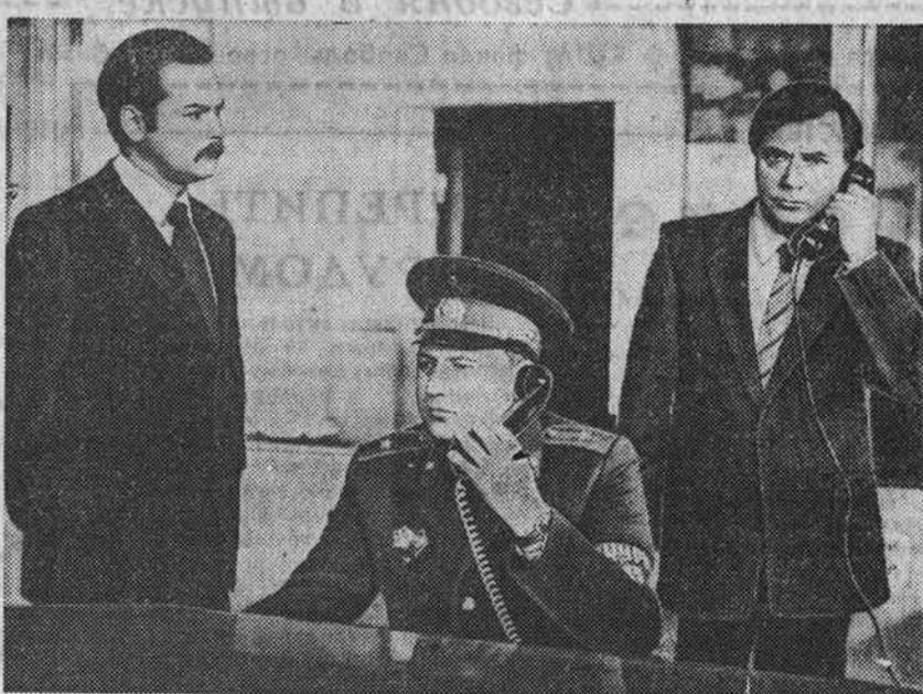
...В КОНЦЕРТНЫЙ ЗАЛ

6 апреля в 14.11 часов радио «Алтай» предлагает очередную программу радиоклуба «Алтай». В выпуске: В. Сапов «Серебристый тополь» (из цикла «Писатели и время»).