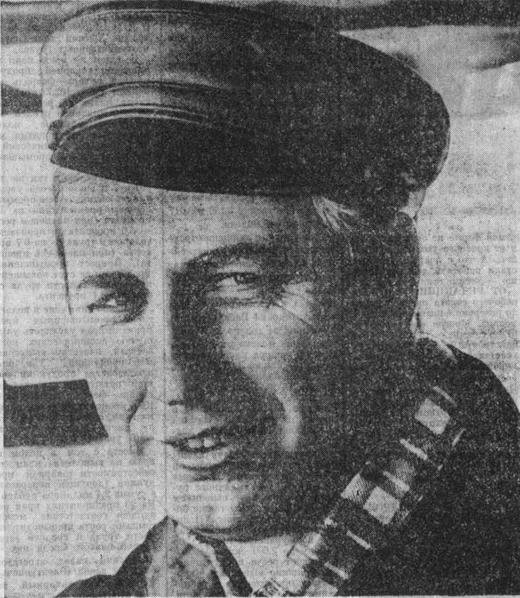
Барнаульское предприятие промышленного железнодорожного транспорта успешно справило со своими обязательствами — выполнило план двух месяцев и дня отсрочки XXVII съезда КПСС.