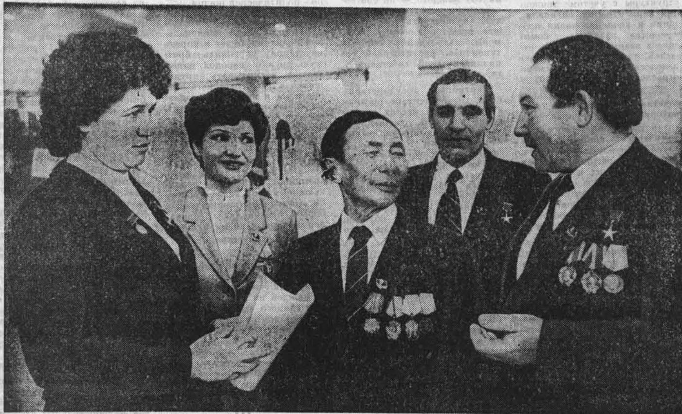
Москва. XXVII съезд КПСС. Делегаты Алтая беседуют в перерыве между заседаниями съезда.