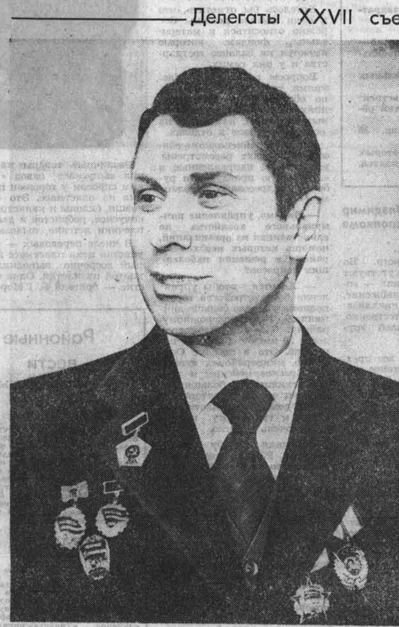
Делегаты XXVII съезда КПСС