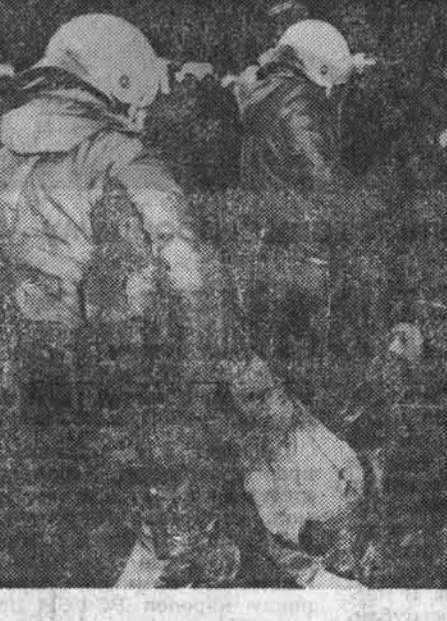
В баварском местечке Ваккерсдорф продолжается манифестация представителей демократической общественности ФРГ в знак протеста против сооружения там предприятия по переработке радиоактивных отходов.